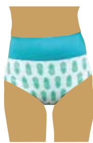
腰の生地を伸ばしてハイウエストにしています。