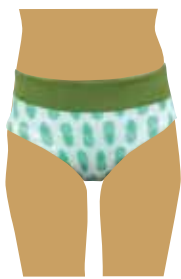
腰の生地を折り曲げています。