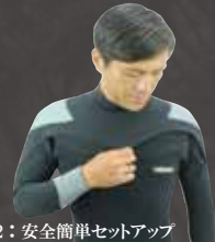
超 2: 安全簡単セットアップ