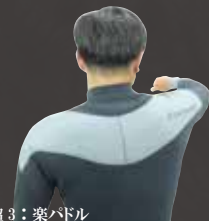
超 3: 楽パドル