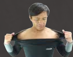
超 1: 楽着脱