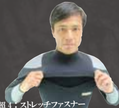
超 4: ストレッチファスナー